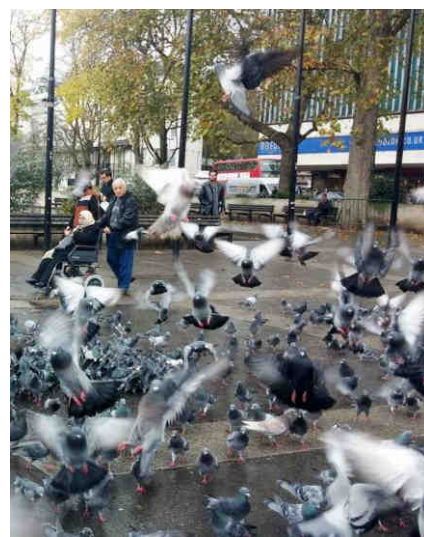
Natáčení Hitchcockova hororu Ptáci