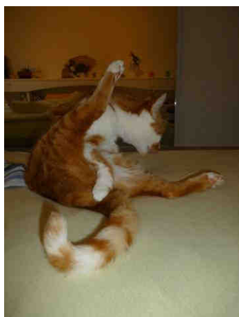
Copak nemůžu mít kousek soukromí