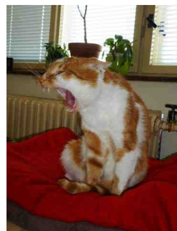
NEŘVI NA MNE!!!