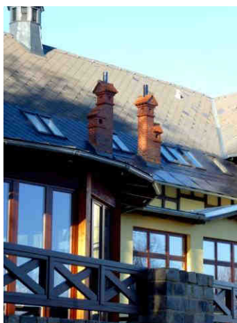
Domečky pro uzené trpaslíky