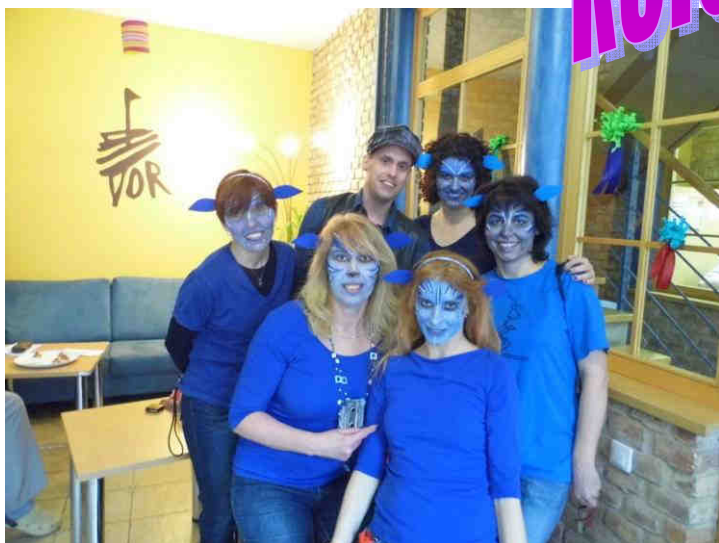
I Avataři mají svého albína